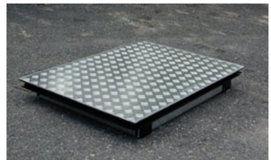
Fig 9. Plan enkellucka