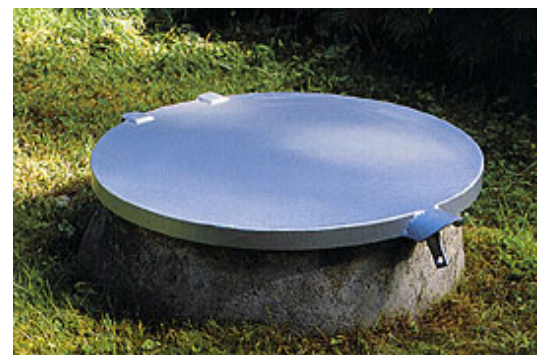
Fig 10. Rund lucka